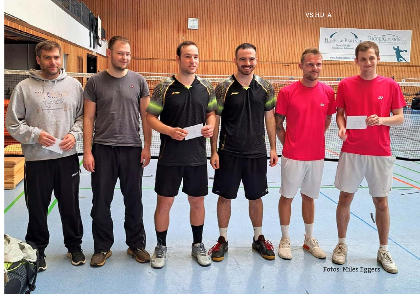
VS HD A