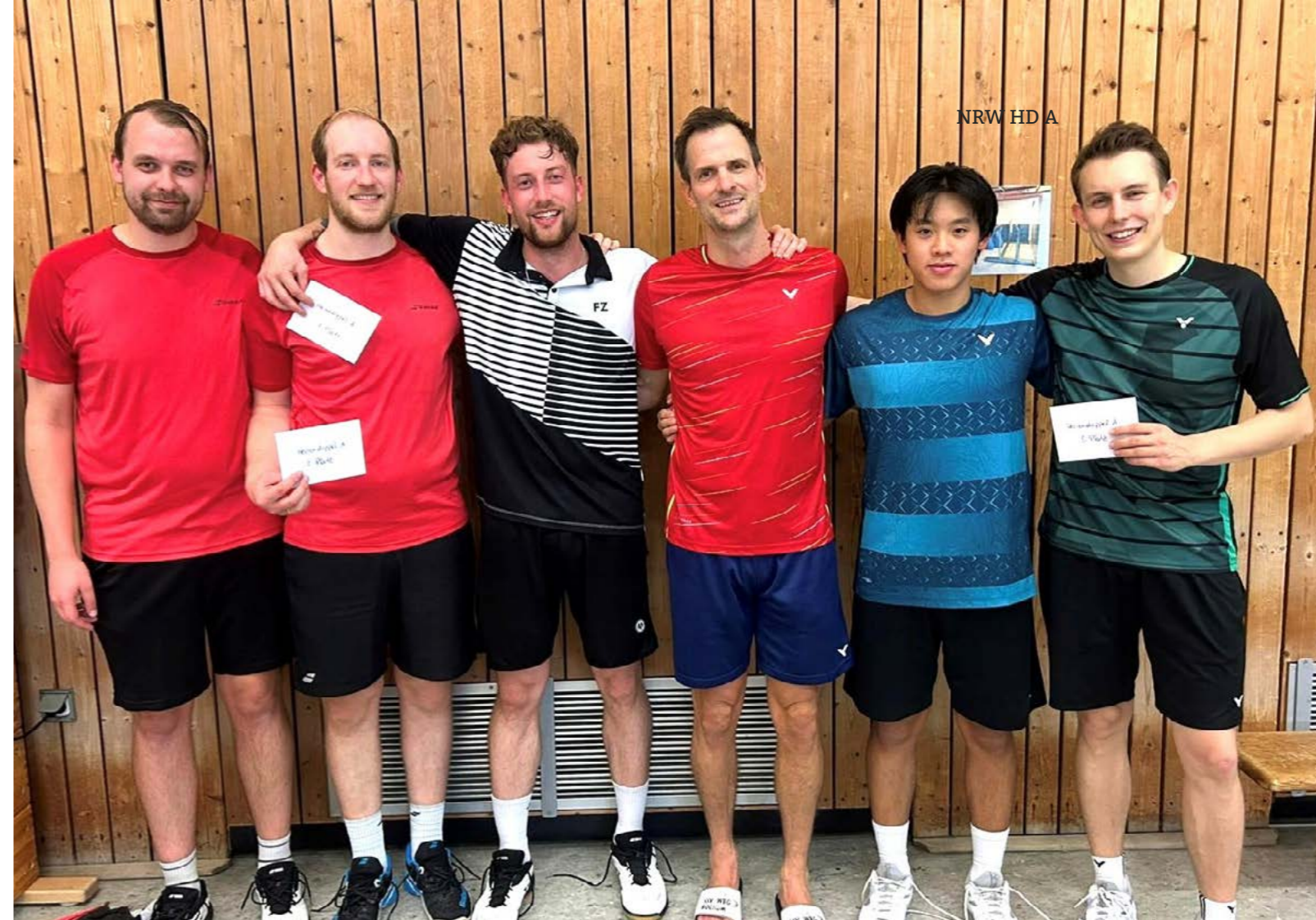
NRW HD A