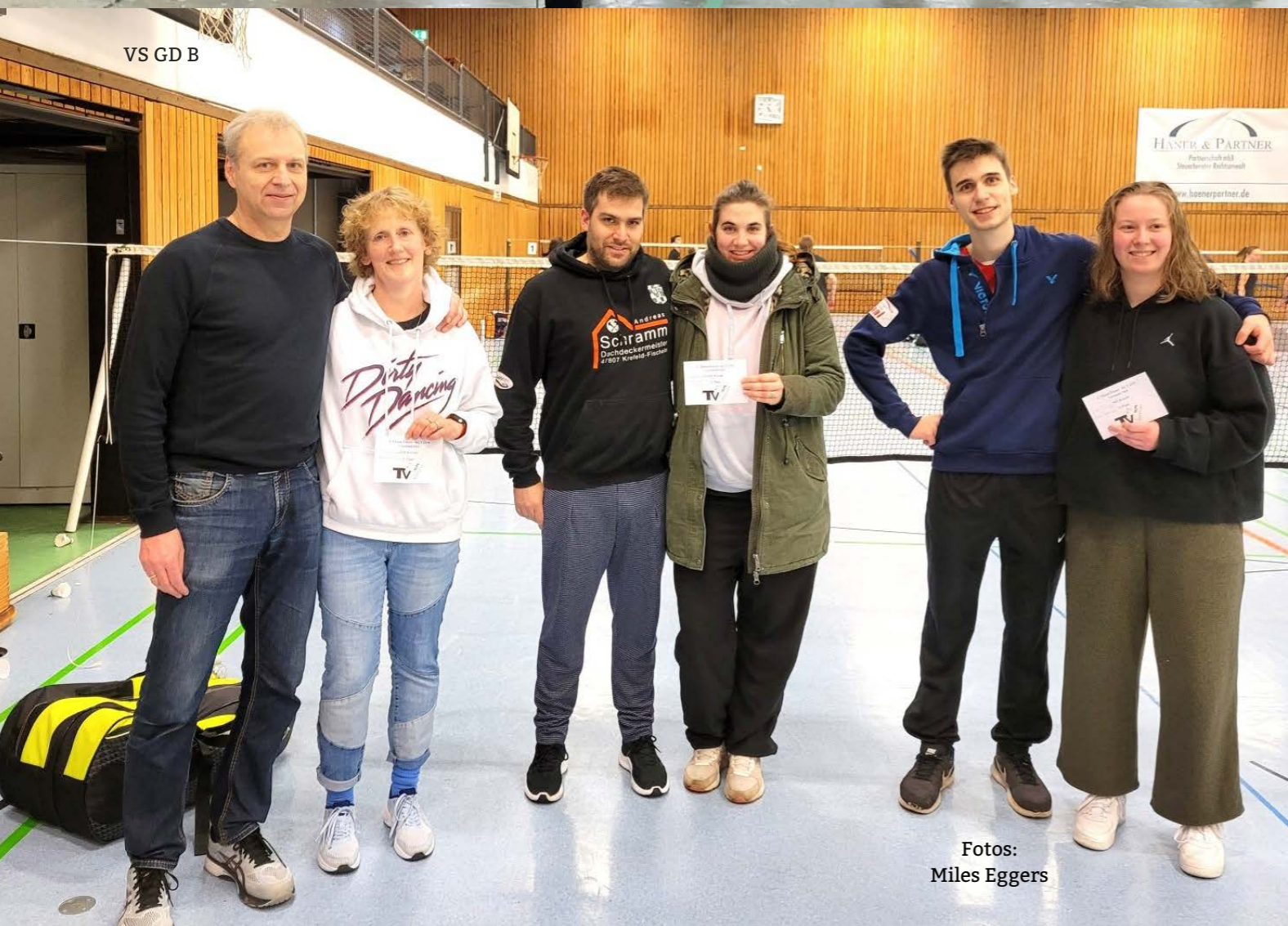
VS GD B