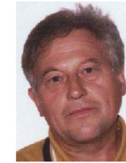
Hans Hermann Drüen Sportbildungswerk des LSB NRW e.V. Außenstelle Badminton