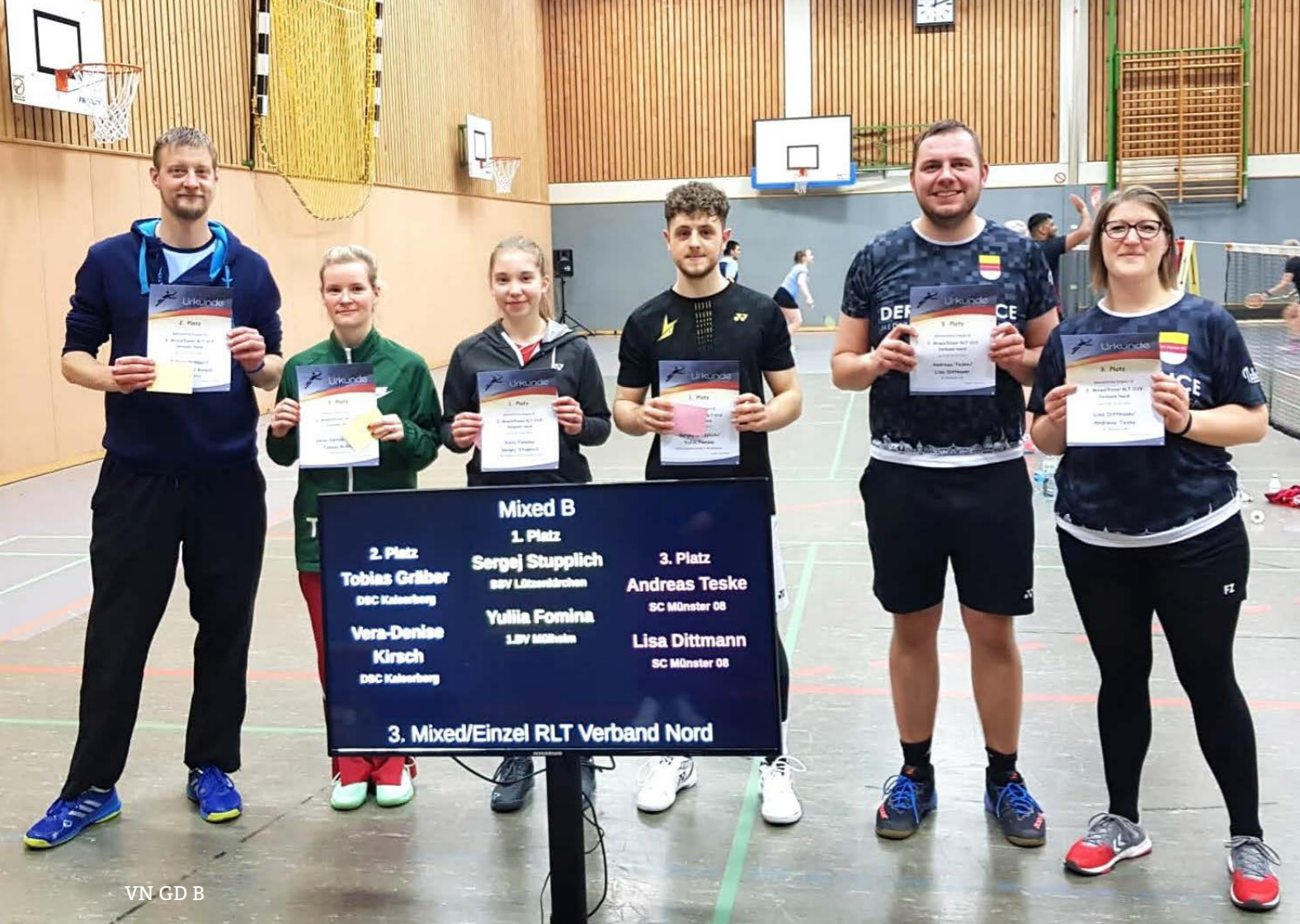
VN GD B