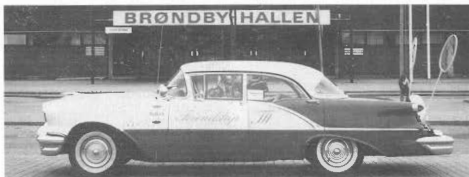
Attraktion vor der Halle: ein Oldsmobil zu Werbezwecken von der Fa. FRIENDSHIP, die auf dieser WM sogar mit einem Stand vertreten war.

WM für Junioren. Ab 1992 wird es eine offizielle Weltmeisterschaft für Junioren geben. Austragungsort wird 1992 Jakarta sein. Geboren dazu wurde die Idee auch in Indonesien mit der Ausrichtung der „Bimantara Juniorships“, an der ja auch alljährlich die Deutschen Jugendlichen, zum Teil mit Erfolg, teilgenommen haben.