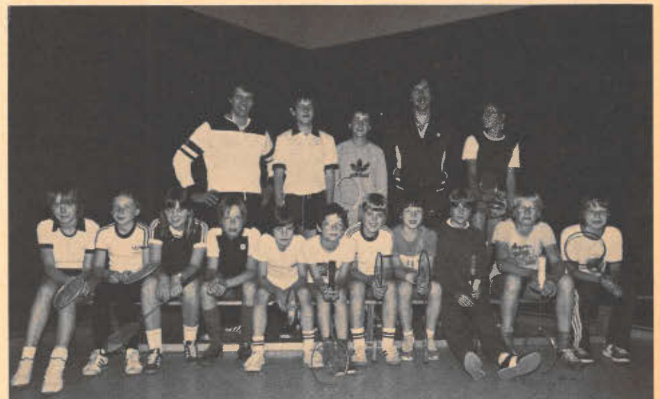
Teilnehmer des Lehrgangs in Leverkusen