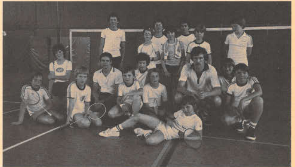
Teilnehmer des Lehrgangs in Köln