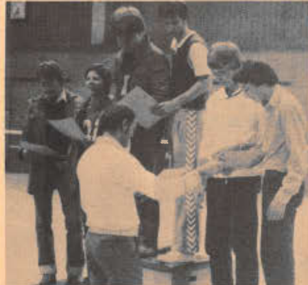
Sieger und Plazierte